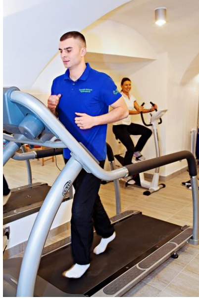
التدريب باستخدام الأجهزة

شكل من أشكال استراتيجية التدريب البدني التي تنطوي على فترات قصيرة متشابكة من الجهد المكثف للغاية مع فترات قصيرة من الجهد المعتدل